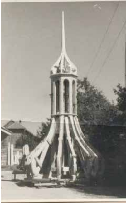
Dachstuhl der Perlachkuppel auf dem Anwesen Schäflein 1947