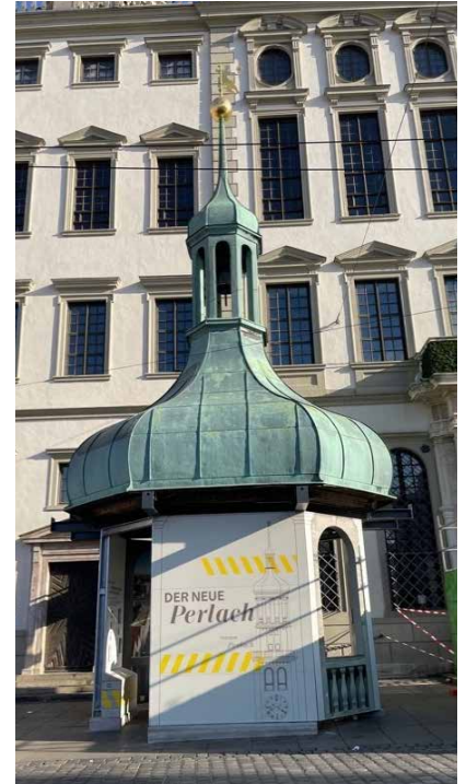
Kuppel des Perlachturms vor dem Augsburger Rathaus

Nach Räumung des Schuttes wurde im Innern ein Gerüst bis zur obersten Plattform errichtet und die Schäden genauestens festgestellt. Nicht benötigte Maueröffnungen und zerstörte Mauerteile wurden zugemauert oder ausgebessert. Der Zusammenhalt des geborstenen Mauerkörpers wurde gesichert durch kreuzweisen Einbau von eisernen Schlaudern mit Spannschlössern. Eine umlaufende massive Treppe und vier Geschoßpodeste in Beton geben die notwendige Querversteifung und Verankerung. Die