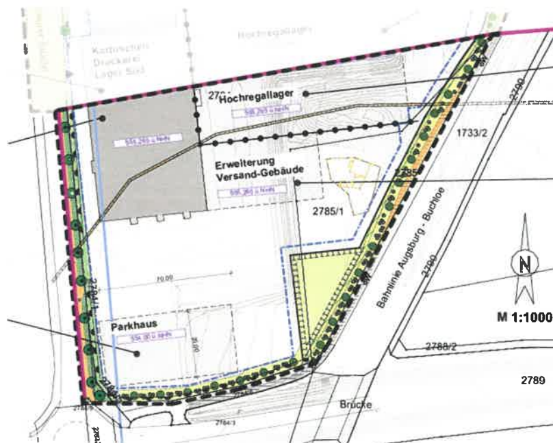
Lageplan mit Geltungsbereich (nicht maßstäblich)

Der Geltungsbereich ergibt sich aus dem nachfolgenden Lageplan: