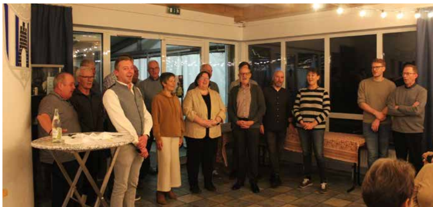
Die Vorstandschaft der SpVgg sang den Jubilaren ein Lied