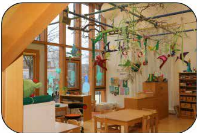
Kindergarten St. Gallus Hauptstr. 2, Langerringen Tag der offenen Tür: 13. März 2026 16:00-18:00 Uhr