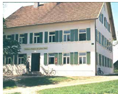
Gastwirtschaft „Grüner Baum“ ca. 1954, heute Schwabmühlhauser Straße 5. Der Saal befand sich im 1. Stock.