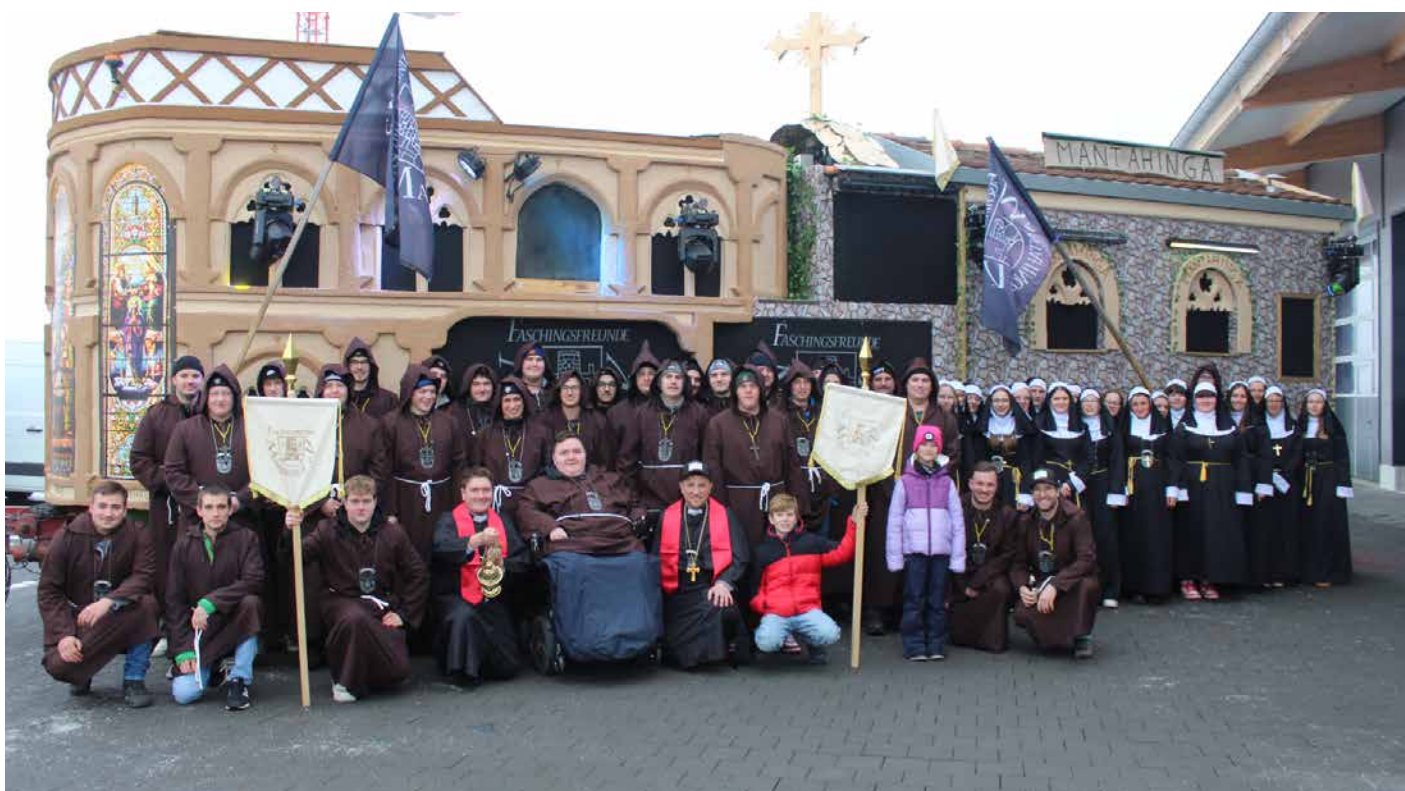
Die Faschingsfreunde treten als Nonnen und Mönche im Kloster Mantahinga auf.