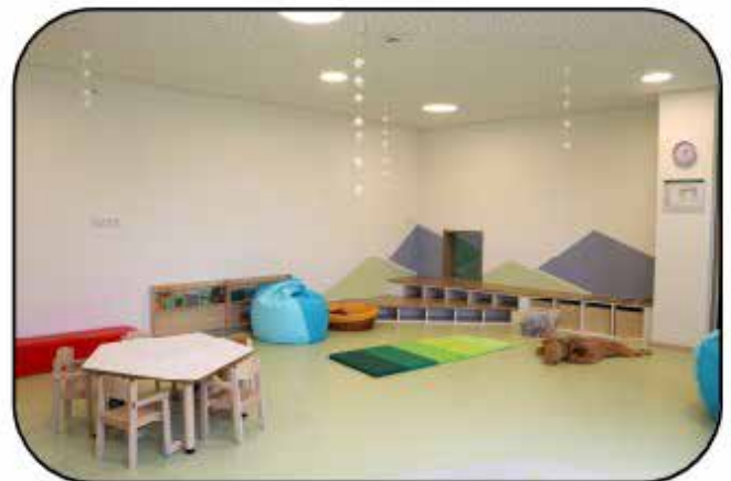
Kinderhaus St. Leonhard Viktor-von-Scheffel-Str. 78 Tag der offenen Tür: 13. März 2026 von 14:30-16:00