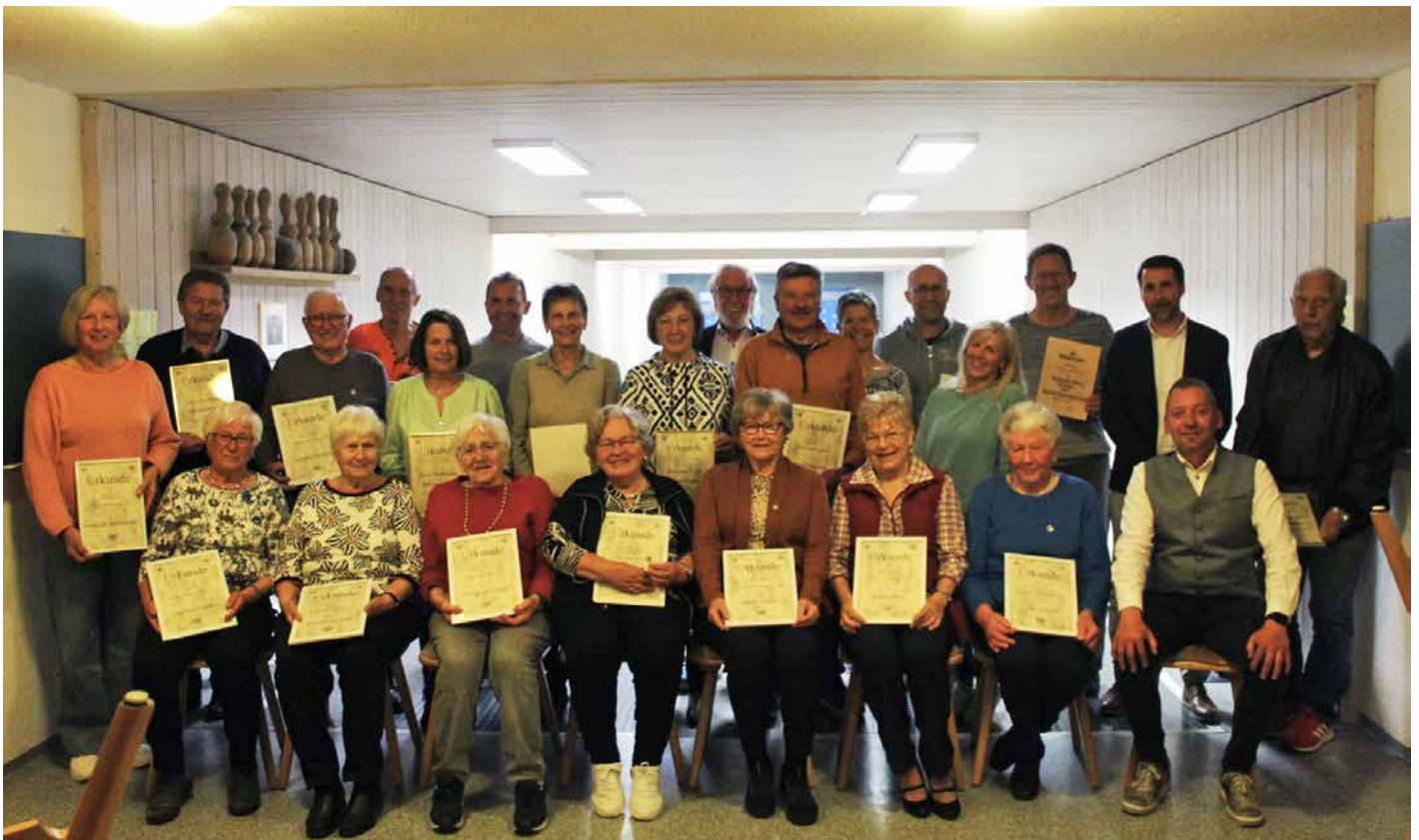
Bei der SpVgg gab es viele Ehrungen!

Die Gymnastik ist mit 586 Mitgliedern die größte Abteilung, in der 13 Gruppen vom Kleinkindalter bis zu den Senioren aktiv sind. Die