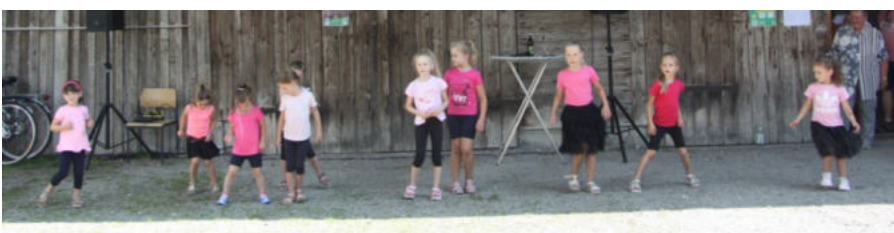
Die Tanzmäuse erfreuten die Besucher