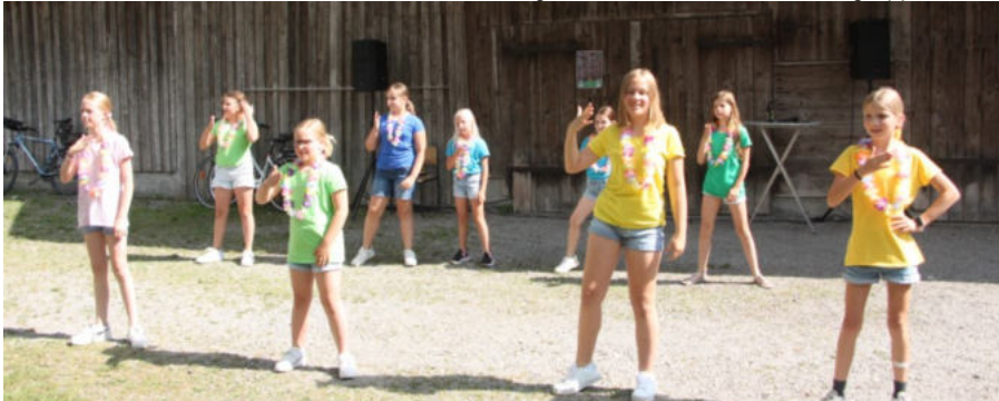
Diese Mädchen haben Spaß am Jazztanz