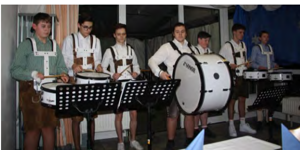
Schlagzeug Ensemble "Gran Cassa"