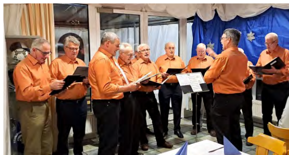
„ Männergesangsverein "Liederkrantz"

Begrüßung der rund 90 Gäste. Traditionell wurde der Ehrenabend mit Liedern des Männergesangsvereins „Liederkrantz“ eingeläutet und danach gab es ein leckeres Abendessen mit Salatbuffet und Dessert, welches die Vereinswirtin Uli Strehle mit dem