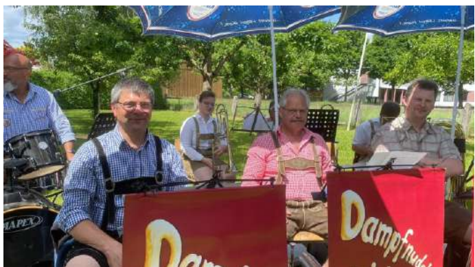
Das Dampfudelgebläse spielte zum Frühschoppen auf

Nach zwei Jahren endlich wieder ein Vatertagsfest des Musikvereins wie es sich alle gewünscht haben! Bei Sonnenschein konnte den ganzen Tag im Garten am Musikatenstadl gefeiert, getrunken und getanzt werden. Das Dampfudelgebläse und das Blasorchester sorgten für gute Stimmung und freuten sich über zahlreiche Besucher.