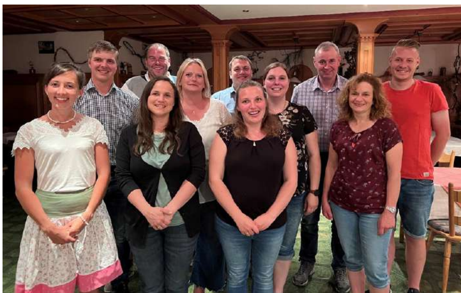
Neu gewählte Vorstandschaft des BBV Ortsverbandes und der Landfrauen

Vorstandschaft des Obst- u. Gartenbauvereins