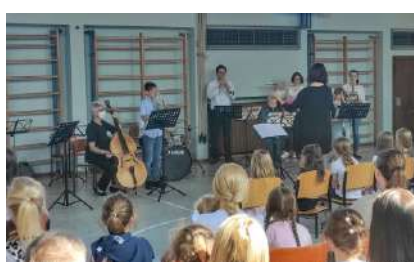
Bläserklasse II gemeinsam mit Musiklehrern