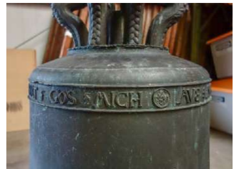
Marienglocke mit Ausschnitt der Inschrift, die auf den Glockengießer Sebolt hinweist

Die Marienglocke: „Bez. Maister Sebolt (Schönmacher I oder II, Augsburg), 1. Viertel 16. Jhd., Ø 91 cm, H. 73,5 cm. Schulterinschrift in Kapitalen mit E in Epsilonform zwischen Schnurstegen: (Sitzender, schreibender Evangelist Markus mit Löwe in runder Plakette) AVE ☿ MARIA ☿ GRACIA ☿ PLENA ☿ DOMINVS ☿ TECUM ☿ MAISTER ☿ SEBOLT ☿ GOS ☿ MICH. Kronenbügel bärtiger Männerkopf, in Zopf übergehend.“