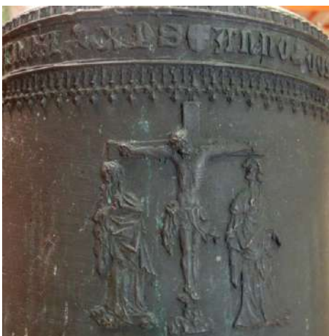
Kreuzigungsglocke: Relief der Kreuzigungsszene, darüber Inschrift und Fries

Will man sich mit der Historie der Pfarrei St. Vitus in Westerringen auseinandersetzen, so muss man die der Pfarrei St. Johannes in Gennach mit einbeziehen. Seit Alters her bestand der Pfarrsprengel Gennach-Westerringen im Verbund miteinander und mit dem Sitz in Westerringen, wo sich der Pfarrhof neben der Kirche befand. Als Gennach 1610 eine neue Kirche errichtete, kam die Verlegung des Pfarrsitzes dorthin in Fluss. Aber die Westerringer widersetzten sich immer wieder und erst 1713 kam der Pfarrsitz nach Gennach, Westerringen blieb jedoch zunächst die Mutterkirche für Gennach. Erst seit März 1948 ist St. Vitus Filiale der Pfarrei St. Gallus in Langerringen.