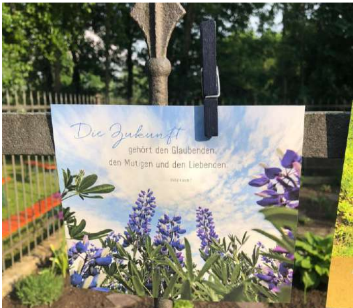
Karten mit besinnlichen Sprüchen gab es im Anschluss an die Andacht zum Mitnehmen

Unter diesem Motto fand im Garten an der Westerringer Kirche eine Andacht rund um das Thema Natur statt. Die Gallusfrauen und zahlreiche Besucher genossen eine Stunde mit Gesang und besinnlichen Texten.