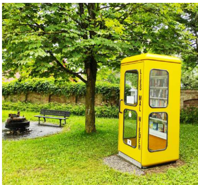
Neuer Standort der Telefonzelle am La Baconniere Platz