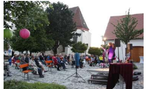
Erstes Open-Air Konzert nach langer Zeit vor dem Gemeindezentrum