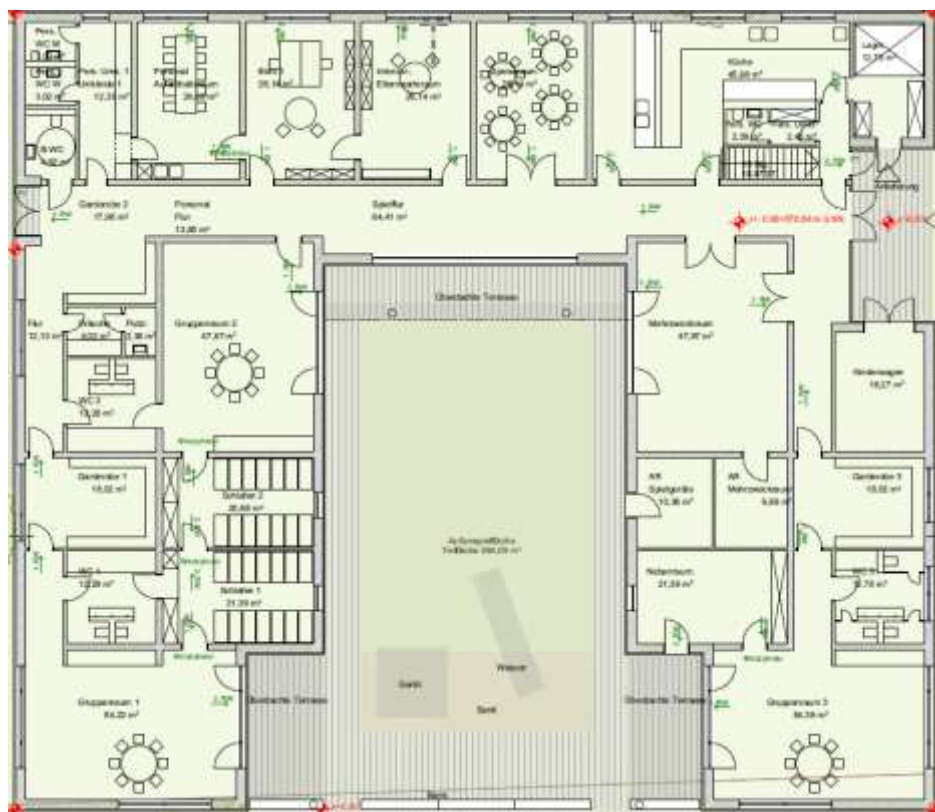
Ausschnitt Grundriss Neubau des Hauses für Kinder Langerringen