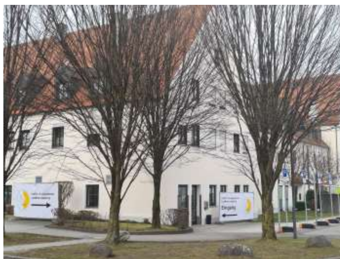
Das neue Impfzentrum ist seit 8. März in Bobingen geöffnet

zugewiesen. Bei Personen, die sich bereits im Vorfeld registriert haben und für die zunächst das Impfzentrum in Gablingen-Siedlung vorgesehen war, wird dies im Nachgang automatisch durch das System des Freistaats angepasst. Ab Samstag, 6. März, werden die ersten Terminvereinbarungen über BayLMCO möglich sein. Termine, die bereits für Gablingen-Siedlung vereinbart waren, können nicht auf Bobingen umgeschrieben werden. Verimpft werden alle bisher vorhandenen Impfstoffe von BioNTech, AstraZeneca und Moderna.